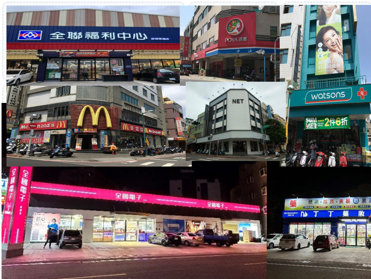
📍 澎湖生活剪影 (11張空間預留)