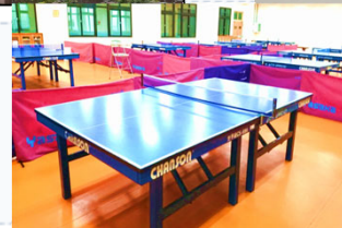
國立澎科大 運動館