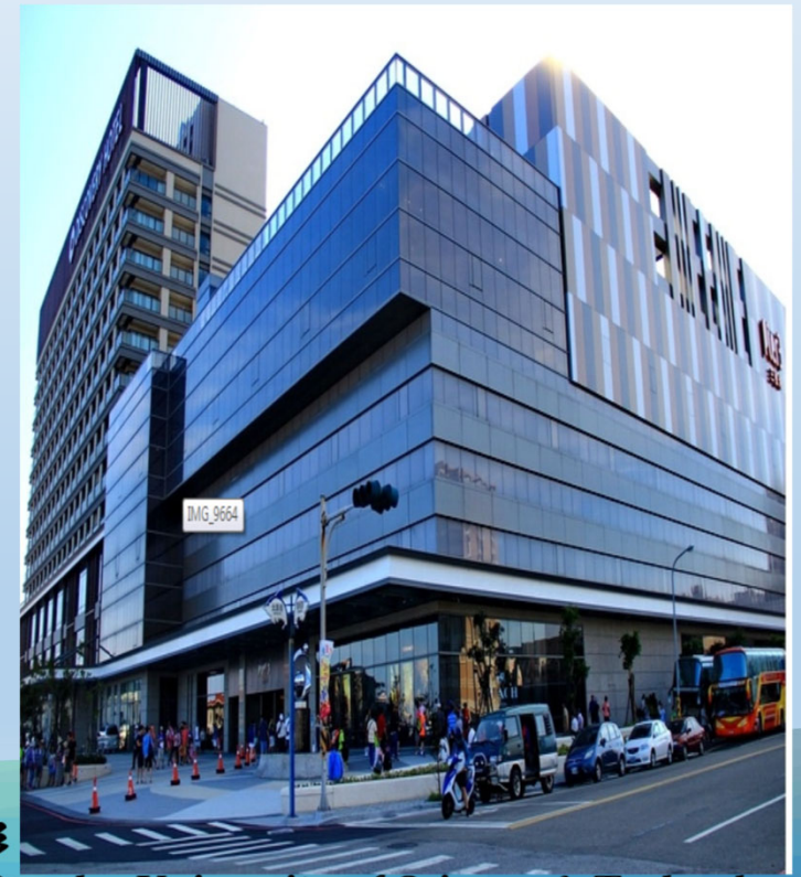
National Penghu University of Science & Technology