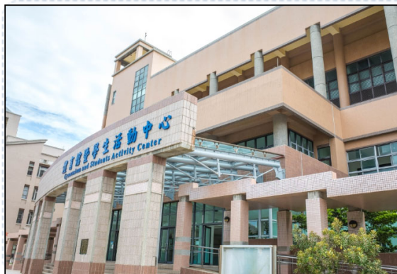
📷 實地設備照片牆 (7張預覽)